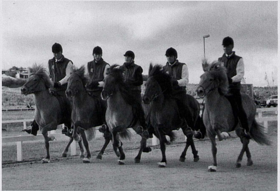
Frá Landsmóti 2000 í Reykjavík. Fimm fulltrúar Fets á ræktunarbússýningu landsmótsins.