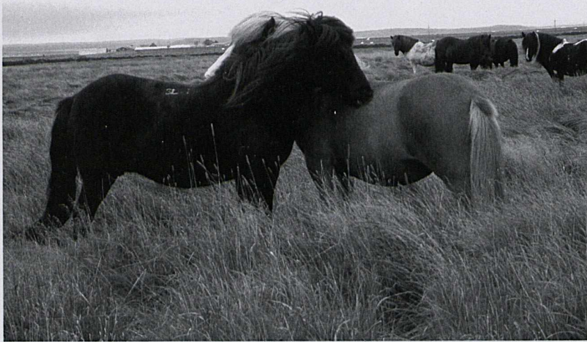
Tvær hryssur í stóði Brynjars að kljást. (Ljós. Hulda Geirsdóttir).