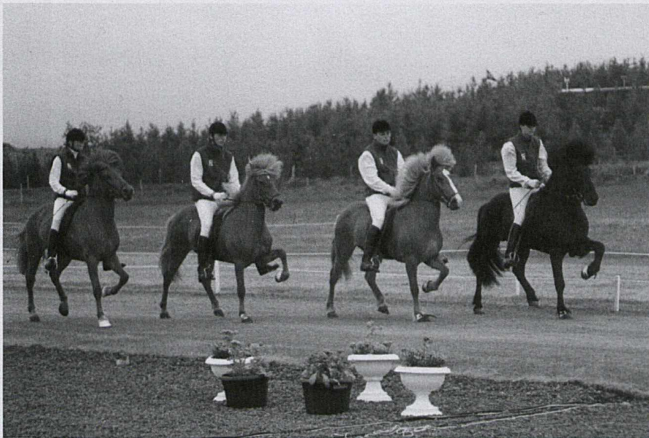
Frá Landsmóti á Vindheimamelum 2002. Fjórir fulltrúar Fets á ræktunarbúsýningu landsmótsins.