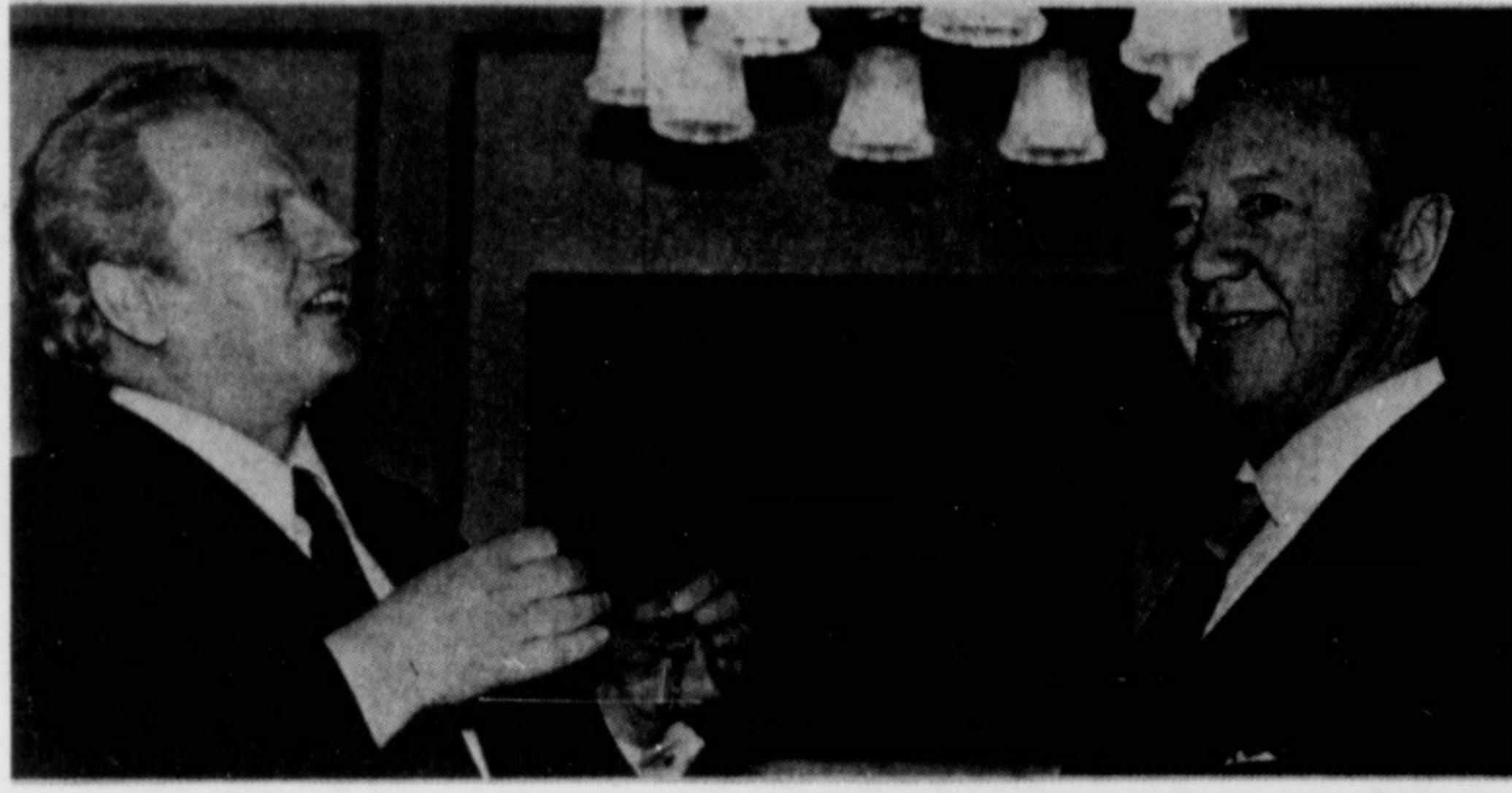
BENEDIKT GRÖNDAL, socialdemokrat og statsminister i det afgåede forretningsministerium overdrager magten til den nye islandsk statsminister Gunnar Thoroddsen, Selvstændighedspartiets næstformand. Thoroddsens regering vil arbejde for en sund »islandsk« kapitalisme baseret på fiskeri, landbrug og industri på islandske hænder.

Så begyndte det at gå hurtigt. I dybeste hemmelighed indkaldte Selvstændighedspartiets næstformand, Gunnar Thoroddsen, Fremskridtspartiet og Folkealliancen til drøftelse. Den 1. februar kastede Thoroddsen en bombe ind i sit parti. Han meddelte, at han var nået til enighed med de to partier om at danne en rege-