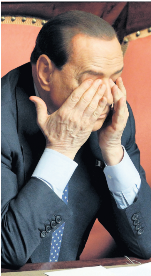
Tre stakler. Silvio Berlusconi kan se frem til at blive retsdyldigt dømt og få afsluttet sin politiske karriere.

Berlusconi står til fremgang i meningsmålingerne og kunne måske være fristet til et hurtigt nyvalg i utide. Men én ting er meningsmålinger, noget andet er selve resultatet. Med den nuværende valglov risikerer Berlusconi også at tabe alt til Beppe Grillo, komikeren, der er blevet Italiens nye oppositionsleder, og som ikke vil udvise samme forståelse over for Berlusconi og hans be-