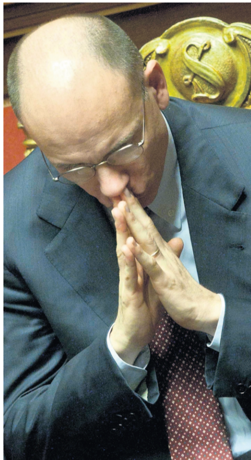
Den nye regeringsleder Enrico Letta blev valgt som summen af alles udelighed og har givet løfter til højre og venstre.

Det er grunden til Berlusconis næsten eksemplariske opførsel siden parlamentsvalget, og at han har ladet sig spise af med en indenrigsministerpost til sin partiformand Angelino Alfano som den fedeste luns til sit parti i forbindelse med dannelsen af Letta-regeringen. For Berlusconi handler det først og fremmest om at gøre sine hoser grønne hos præsidenten, som også er præsident for de italienske dommeres selvstyrende regering, og uanset hvad kan lægge et ord ind for Berlusconi. Hvis det var Berlusconi skattedom på fire års fængsel, som fik ham til at vende tilbage til politik sidste efterår, så vil endnu en dom i denne eller andre sager formentlig få ham til at trække sin støtte til den nye regering.