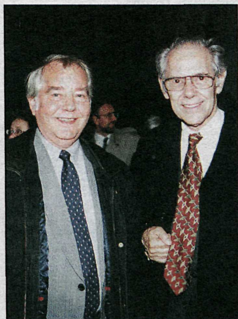
Tvö tónskáld: Petr Eben og Porkell Sigurbjörnsson á góðri stund í Prag.