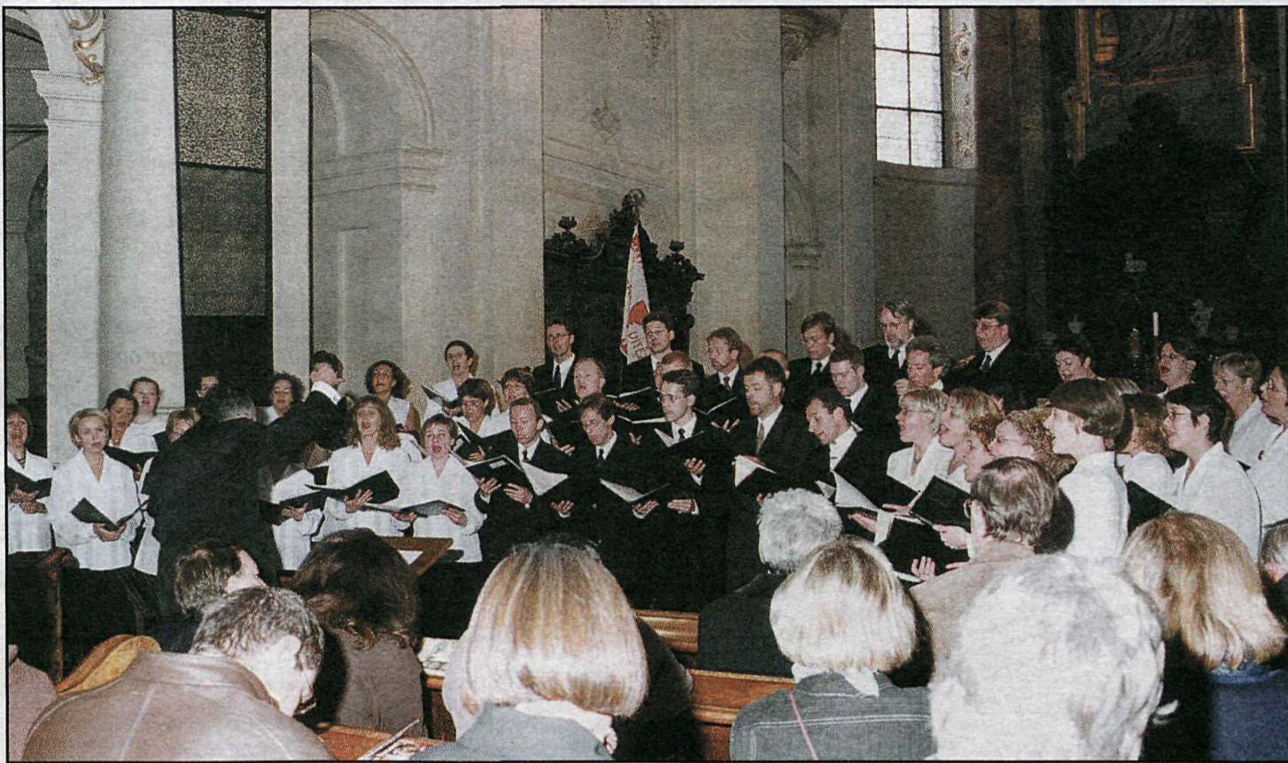
Dómkórinn syngur í kirkju heilags Nikulásar við Gamla torgið í Prag.