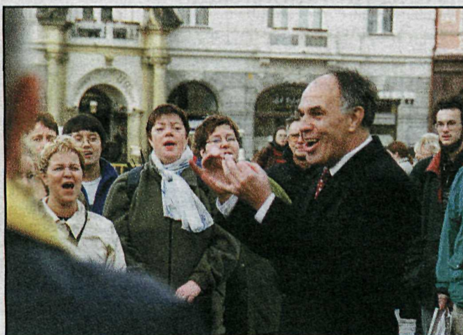
Sungjó fyrir gesti og gangandi á Gamla torginu þar sem hjarta Tékklands slær í takt við klukkurnar frægu í ráðhúsinu.

Eftir stríðið settist hann að í Prag og hélt þar áfram tónlistarnámi. Árið 1948 innritaðist hann í Tónlistarakademíuna í Prag og nam þar pianóleik og tónsmíðar næstu sex árin. Hæfileikar hans til að miðla öðrum komu fljótt í ljós og hann var skipaður kennari við Karlsháskóla árið 1955. Þar kenndi hann upp frá því samhlíða tónsmíðum.